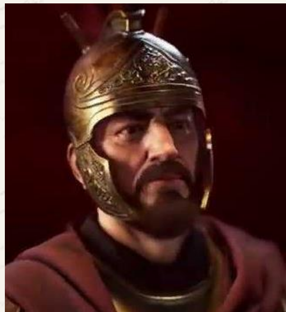
Компьютерная реконструкция внешности Камилла