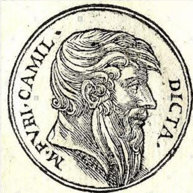
Древнеримская монета с портретом Камилла