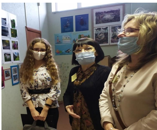
Жюри и участник