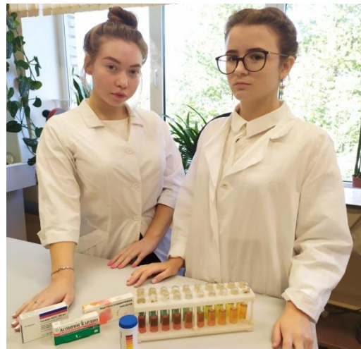
Исследование состава аспирина различных марок