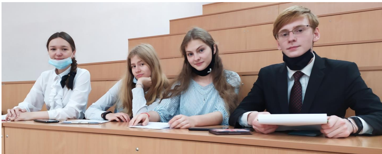
Готовимся к защите